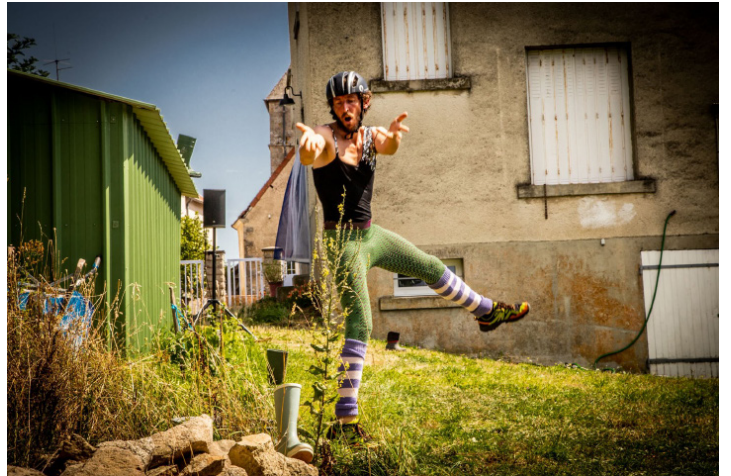
Georgette K7

Le festival sort du cadre de l'écoute pure avec trois performances. Georgette K7 de Mathias Forge fait dialoguer avec humour actions scéniques, gesticulations et conseils maternels enregistrés sur cassette. Avec Radiographies , Coline Bardin mêle radiographies médicales et témoignages enregistrés pour tisser un récit collectif autour des blessures, les siennes et celles du public. Enfin, Matière (noir, blanc, bleu) de Nêmo Camus s'attache à rendre visible la face cachée de nos vies technologiques.